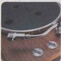
唱盤上有開關及轉速選擇鈕。