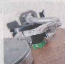
使用 Audio-technica MM 型唱頭 (AT95E)。