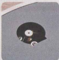
唱盤下有橡皮圈，使用時需要扣上轉軸。

Teac 繼續使用 audio-technica MM 型唱頭（AT95E），又內置了使用發燒級擴音晶片（NJM8080）的 Phono 擴音，將黑膠盤接到小型音響或家庭影院擴音機都能夠使用。e