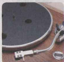
唱臂改用 S 形，並用上獨特的防震及平衡技術。

而 TN-400BT 在型號數字後加上 BT，BT 正是 Bluetooth 藍牙的縮寫，能夠無線傳送音效，並支援 aptX 及 AAC 無線音效編碼，要藉藍牙耳機或是藍牙喇叭聽歌可謂無難度。