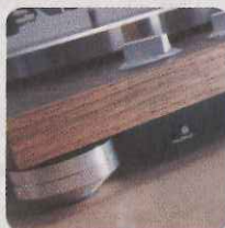
Pairing 按鈕則收藏在機底，以防誤觸。