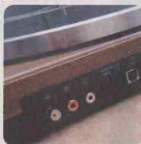
機背設有 USB、RCA 音頻等輸出。